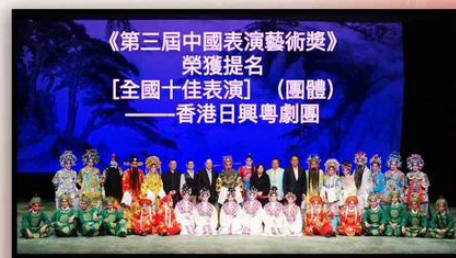
《第三屆中國表演藝術獎》 榮獲提名 [全國十佳表演] (團體香港日興粵劇團)

推廣粵劇戲曲藝術文化，務求以認真專業的態度去製作演出。並於在不同行業、團體推介粵劇藝術文化之演出活動，使更多人士了解及認識，吸引更多人士喜愛欣賞，並加入參與支持粵劇傳承發展，並凝聚一班熱愛粵劇及熱心回饋社會朋友，透過演出以服務社會思維，帶給長者和青少年得到娛樂及身心發展的好處。