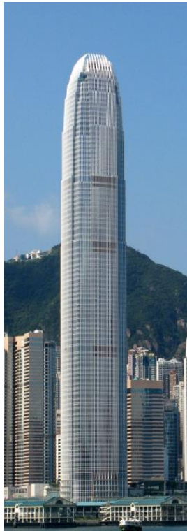
2 nd : 國際金融中心二期 415 米