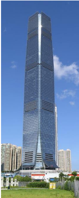
1 st : 環球貿易廣場 484 米