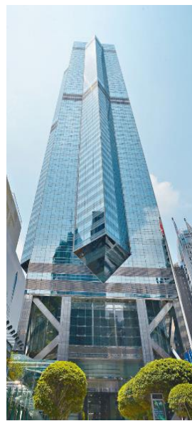
5 th : 中環中心 346 米