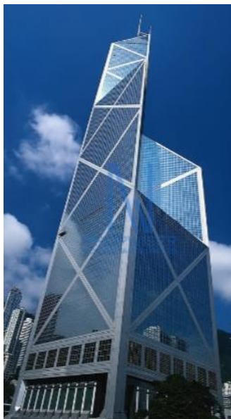
4 th : 中銀大廈 367 米