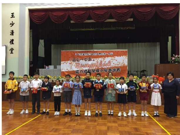
我校代表(右二)獲頒第一回合達標獎