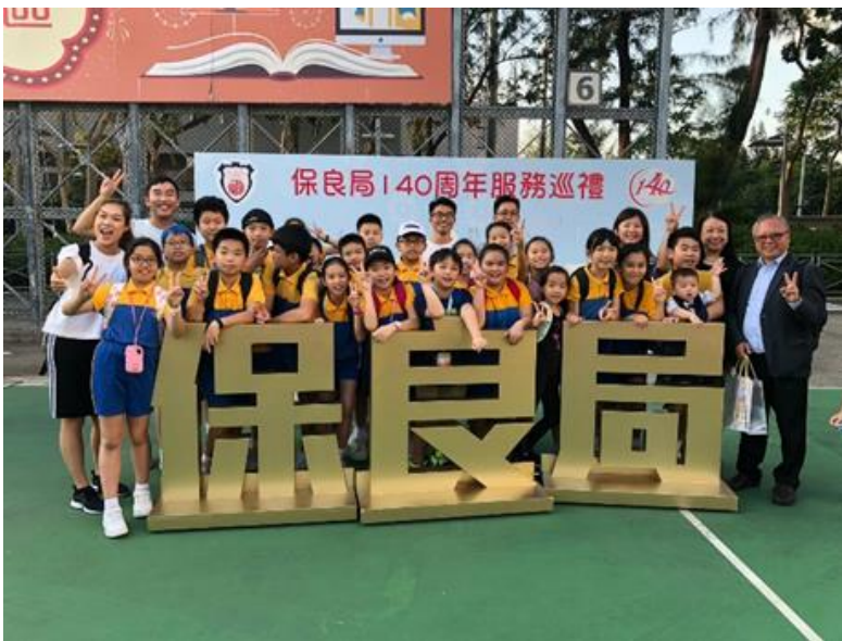
校長、老師及同學們大合照！

本年 10 月 21 日為保良局 140 周年服務巡禮。當日於維多利亞公園展示了有關保良局的歷史及轄下 300 多個單位的服務。除此，當天還舉行了典禮開幕儀式，並有不同的綜藝表演，場面非常熱鬧。另外，場地亦設有創新科技專區、親子玩樂及學習體驗、各項多元化服務攤位以及市集等，讓大家認識保良局不斷創新的服務。我校作為保良局的一分子，當然也參與這項盛事。我們聯同沙田區的中小學一起以「創藝沙保」為題展示成果。老師和同學們亦為此出一分力，向與會者介紹我們聯校的學習活動，讓公眾加深對我們的認識。