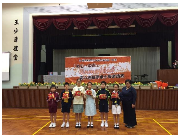
我校代表(右二)獲頒第二回合達標獎