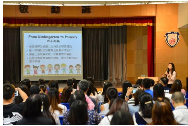
盧珈卓副主任向家長介紹英文自學平台。