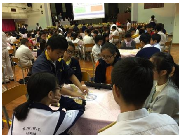
同學奮力出牌，局局精彩