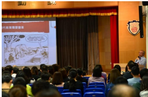
校長跟家長分享學校未來的改變，以及他的教育理念。