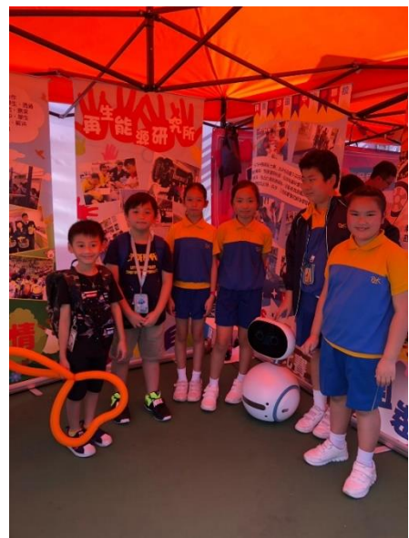
Zenbo 與同學們一起向與會者介紹我們的學習活動。