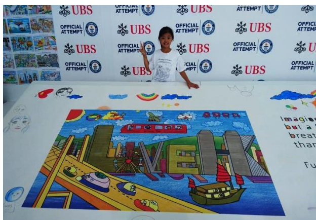
大會將作品放大，置在會場內，供各界人士欣賞。