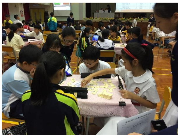
同學將數字磚重新排列成不同的牌組