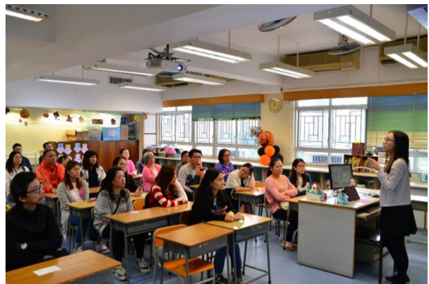
家長與班主任老師會面，老師預備了過去一個月同學們的學習情況，要加強注意的地方等，相信座談會當日，家長一定有很多得著。