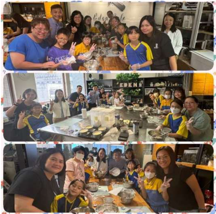
還要打忌廉加到蛋糕上。