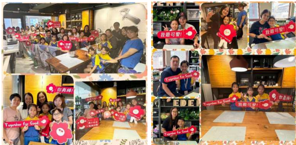
感謝騰信基金會，感謝保良。