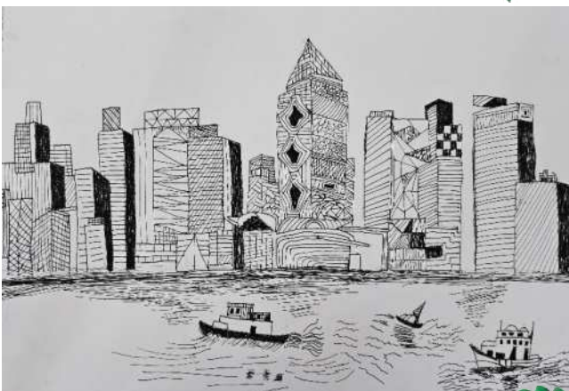
6A 盧俊希《我筆下的維多風情》