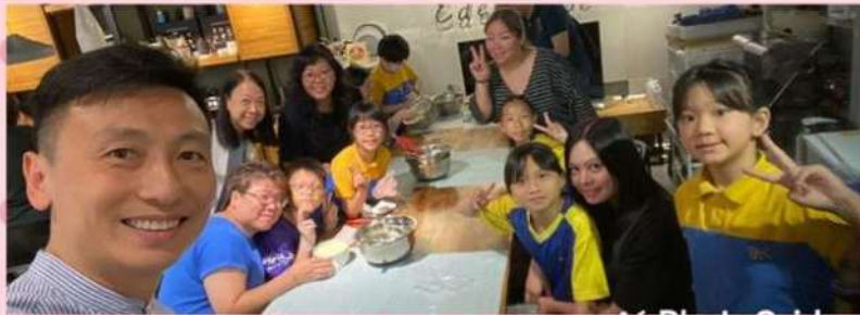
校長特意前來為各位同學打氣。