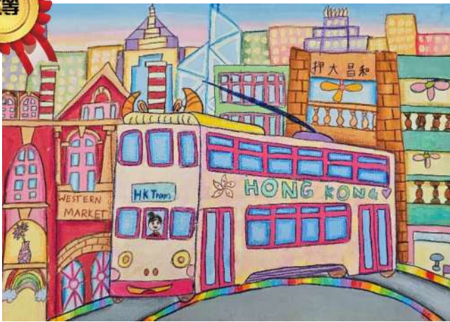
4A 張睿珈《電車駛過彩色繽紛的香港》