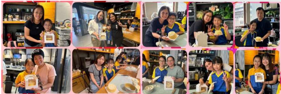
整好啦!用來孝敬爸爸媽媽。