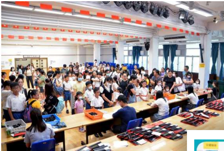
協助買旗的義工首先排隊領取物資。

能夠為有需要的人士出一分力，實在是我們的福氣，祝願今天各位協助親子賣旗的參加者善有善報，福有攸歸。