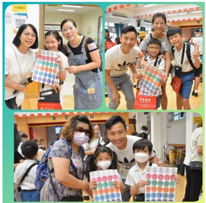
領了物資，大家都急不及待要拍照留念。