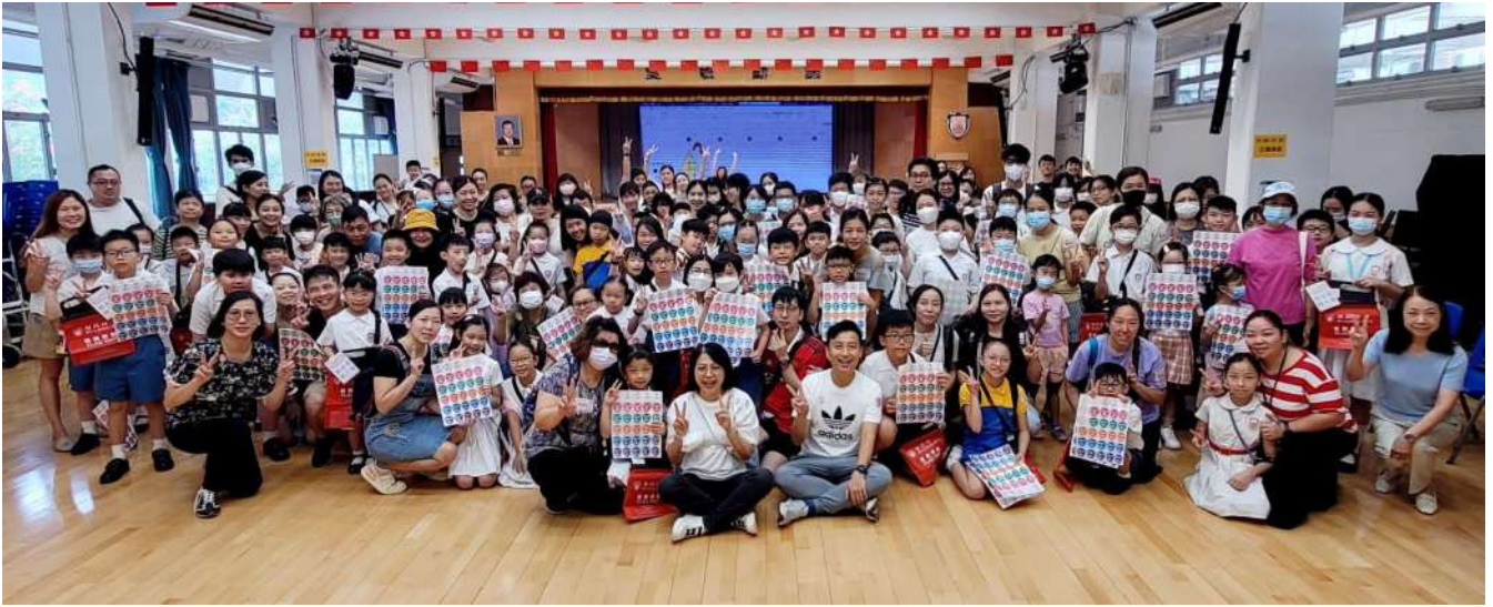
大合照後，大家就浩浩蕩蕩地出發了！